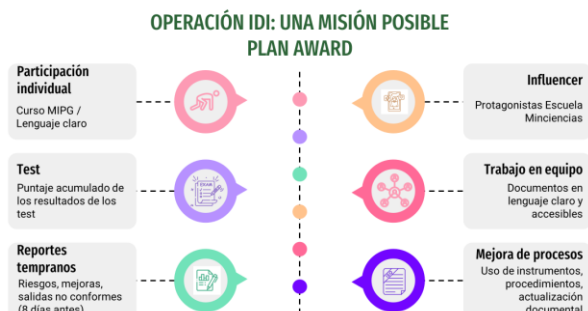
Imagen 4 Presentación - Plan Award