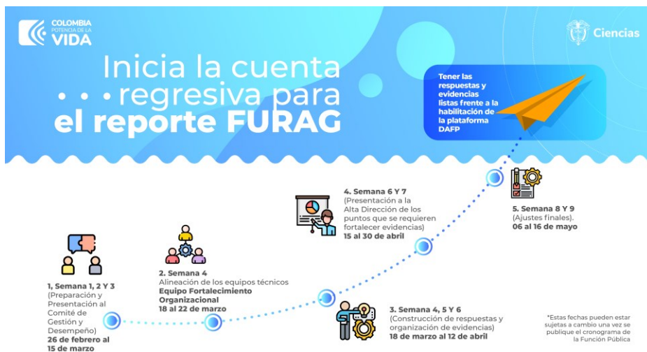
Imagen 6 Ruta FURAG

Posterior a la presentación se realizó la actividad pista de obstáculos en la que se debía transmitir un mensaje asociado al proceso MIPG y la ruta FURAG sorteando posibles obstáculos que los equipos se podrían encontrar para dar respuesta y consolidar las evidencias a la hora de responder el formulario, los cuales fueron representados de manera simbólica con diferentes problemáticas, entre las cuales se encontraban: